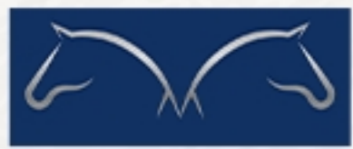
نادي المسائل للإسوارة MESSAYEL EQUESTRIAN CLUB

✓ الجمعية الكويتية لدعم الطلاب ( Kuwaiti Society for Students Support ) موقع للتبرع وتسجيل الطلاب الجدد. (هيئة حكومية)